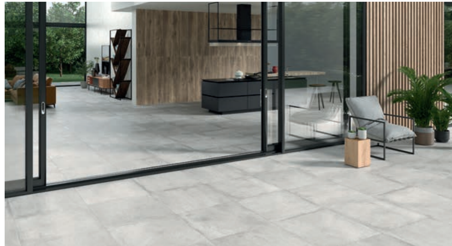
Stoneage Concrete 60x60 R / Stoneage Concrete 2.0 60x60 R

NANOTECH Stoneage Concrete 60x120 R PC614 Stoneage Concrete 100x100 R PC114 Stoneage Concrete 60x60 R PC0624