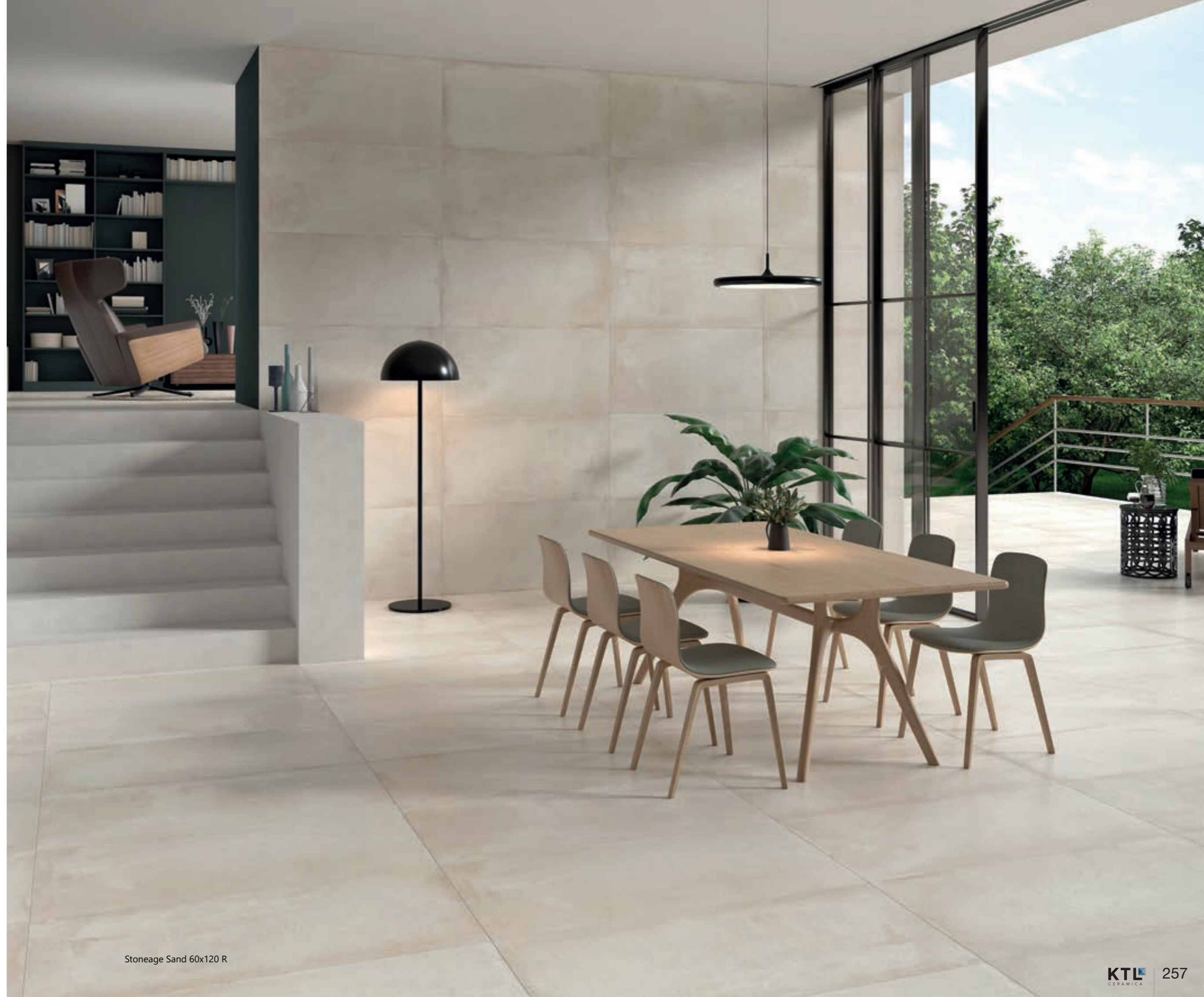
Stoneage Sand 60x120 R