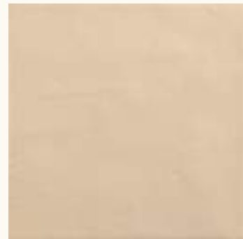
Kromatic Cream LB68