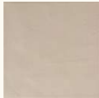
Kromatic Grey LB68