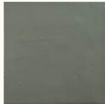
Kromatic Green LB73