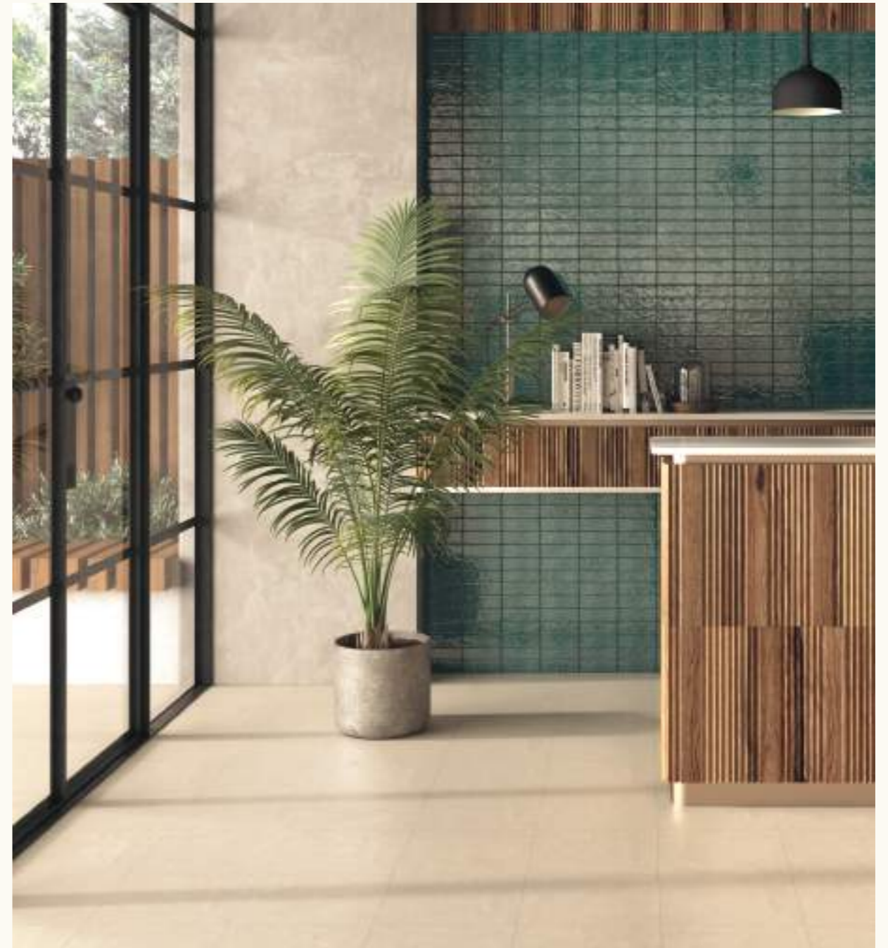
Kromatic Cream | Terre Antic Green 5x15 cm