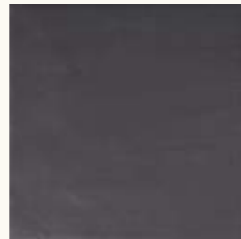
Kromatic Graphite LB68